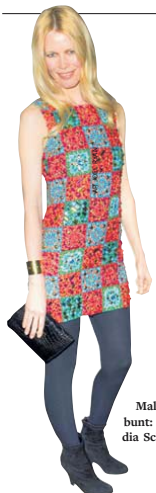
Mal ganz bunt: Claudia Schiffer